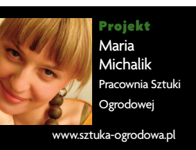
Projekt Maria Michalik Pracownia Sztuki Ogrodowej www.sztuka-ogrodowa.pl

Tekst Katarzyna Jodłowska Rysunki Pracownia Sztuka Ogrodowa